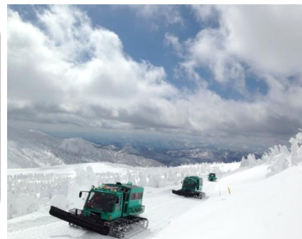
(ワイルドモンスター号イメージ)

世界的にも有名な大自然の芸術品「樹氷」。その美しい世界を、キャビン搭載の暖房付乗用雪上車「ワイルドモンスター号」に乗って間近で鑑賞してみませんか？専属ガイドが軽快なトークで皆様をご案内します！昼食は、白石名物の温麺をご用意しました！伝統の製法で仕上げた麺は、とてもコシが強くヘルシーなのが魅力です♪今回は温麺の製造工場も見学することができますよ。