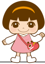
公式キャラクター はまなか あい