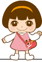
公式キャラクター はまなか あい