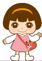
公式キャラクター はまなか あい